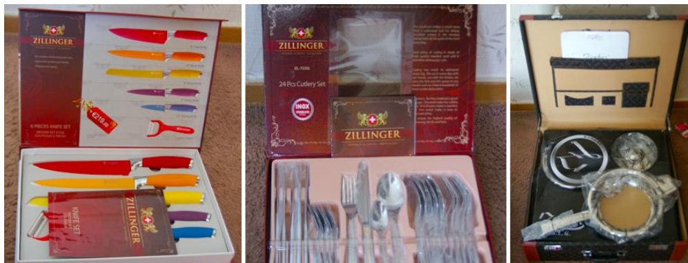
Viltotie trauki, kas tiek uzdoti par Zepter ražojumu

Krāpšanas shēma ir vienkārša. Parasti solīdi ģērbusies persona nejaušiem garāmgājējiem degvielas uzpildes stacijās un autostāvvietās tirdzniecības centru tuvumā piedāvā ar atlaidi iegādāties dažādu zīmolu izstrādājumus, nosaucot tos par Zepter produkciju. Turklāt viņš uzdodas par Zepter vadītāju no citas valsts, bieži vien Polijas, un pamato savu piedāvājumu ar to, ka viņam ir palikuši produkcijas paraugi no izstādes, kurus viņš nevar paņemt līdz lidmašīnā. Ir konstatēti gadījumi, kad kā Zepter produkcija šādā veidā tika pārdoti Zillinger, Zephyr, Zeppelin, Solingen un Hanssen trauki un piederumi. Rīkojoties atjautīgi, krāpnieki ir piemānījuši arī juridisko personu pārstāvjus un iekasējuši no viņiem drošības naudu par traukiem, kurus it kā plāno ziedot organizācijai.